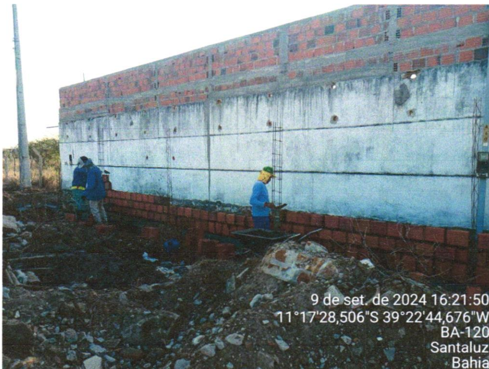
Foto 11 - ALVENARIA DE VEDAÇÃO DE BLOCOS CERÂMICOS FURADOS NA VERTICAL DE 9X19X39 CM (ESPESSURA 9 CM) E ARGAMASSA DE ASSENTAMENTO COM PREPARO EM BETONEIRA. AF_12/20212021

9 de set. de 2024 16:21:50 11°17'28,506"S 39°22'44,676"W BA-120 Santaluz Bahia