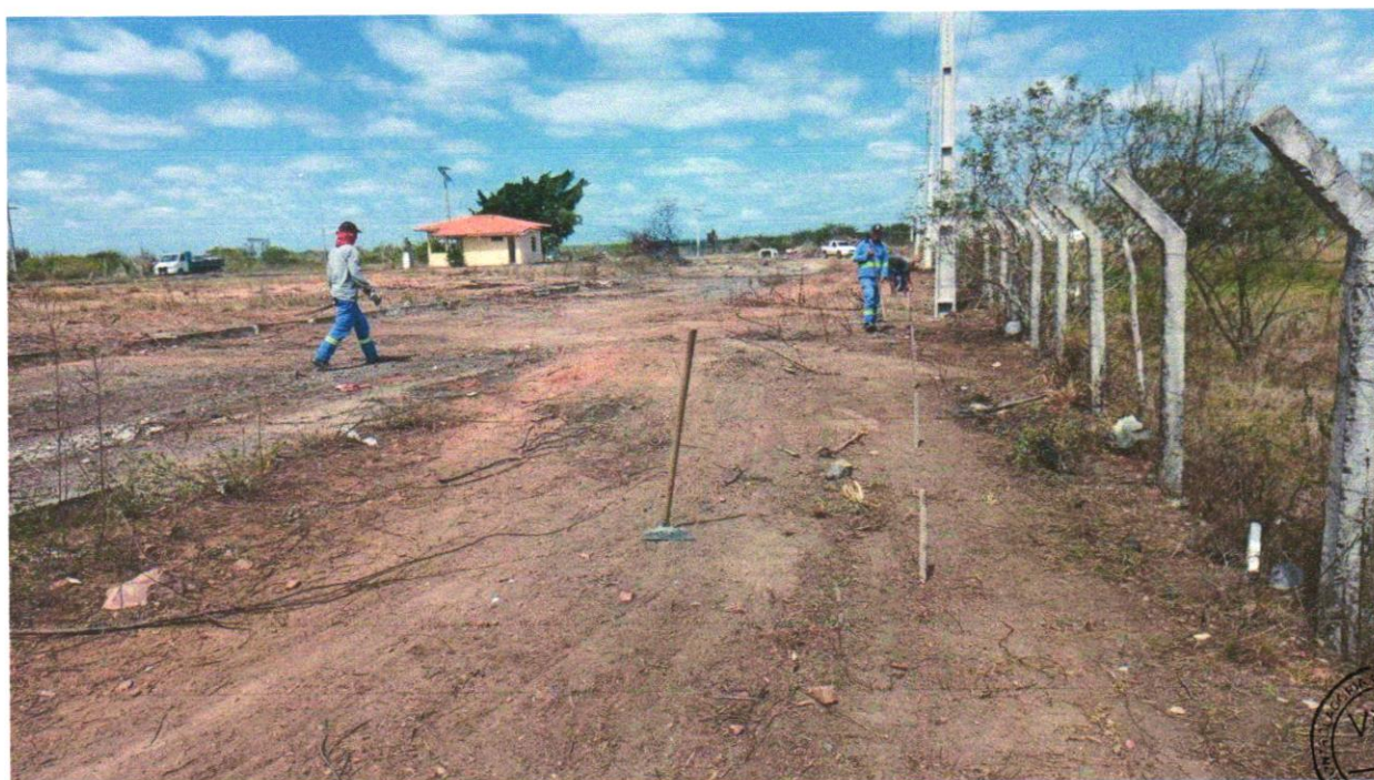
Foto 06 - LIMPEZA MANUAL DO TERRENO COM RASPAGEM SUPERFICIAL (CAPINAÇÃO)