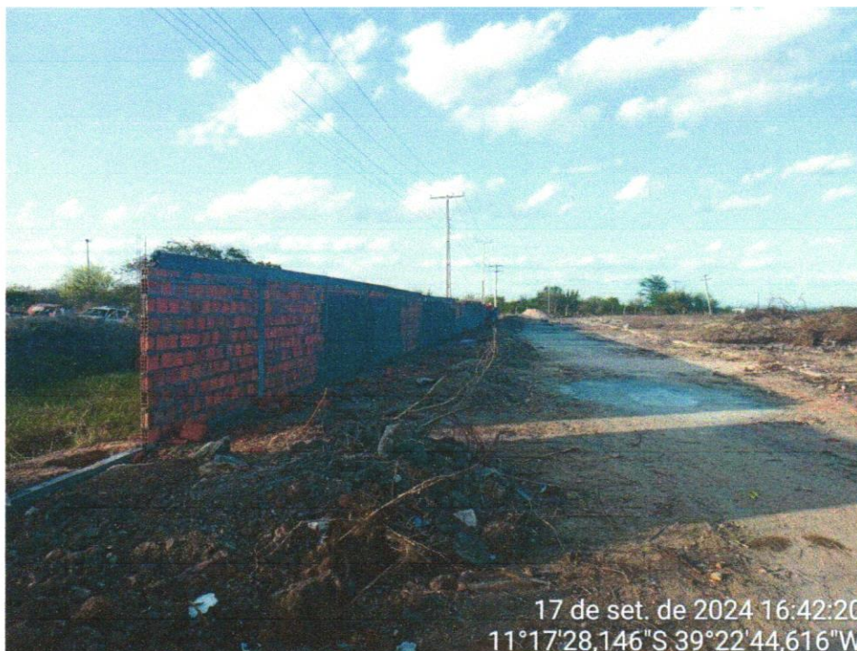
Foto 09 - ALVENARIA DE VEDAÇÃO DE BLOCOS CERÂMICOS FURADOS NA VERTICAL DE 9X19X39 CM (ESPESSURA 9 CM) E ARGAMASSA DE ASSENTAMENTO COM PREPARO EM BETONEIRA. AF_12/2021