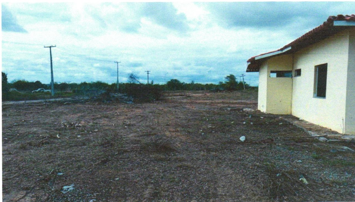
Foto 05 - LIMPEZA MANUAL DO TERRENO COM RASPAGEM SUPERFICIAL (CAPINAÇÃO)

Evaldo Almeida Moraes Engenheiro Civil RNP 051417303-3