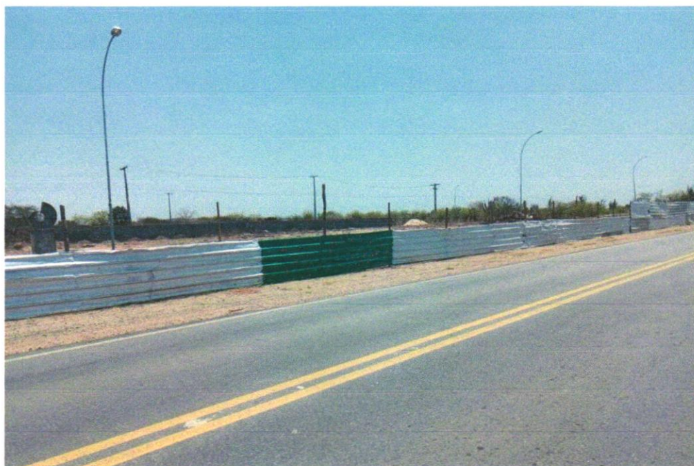
Foto 01 - TAPUME COM TELHA METÁLICA. AF_05/2018