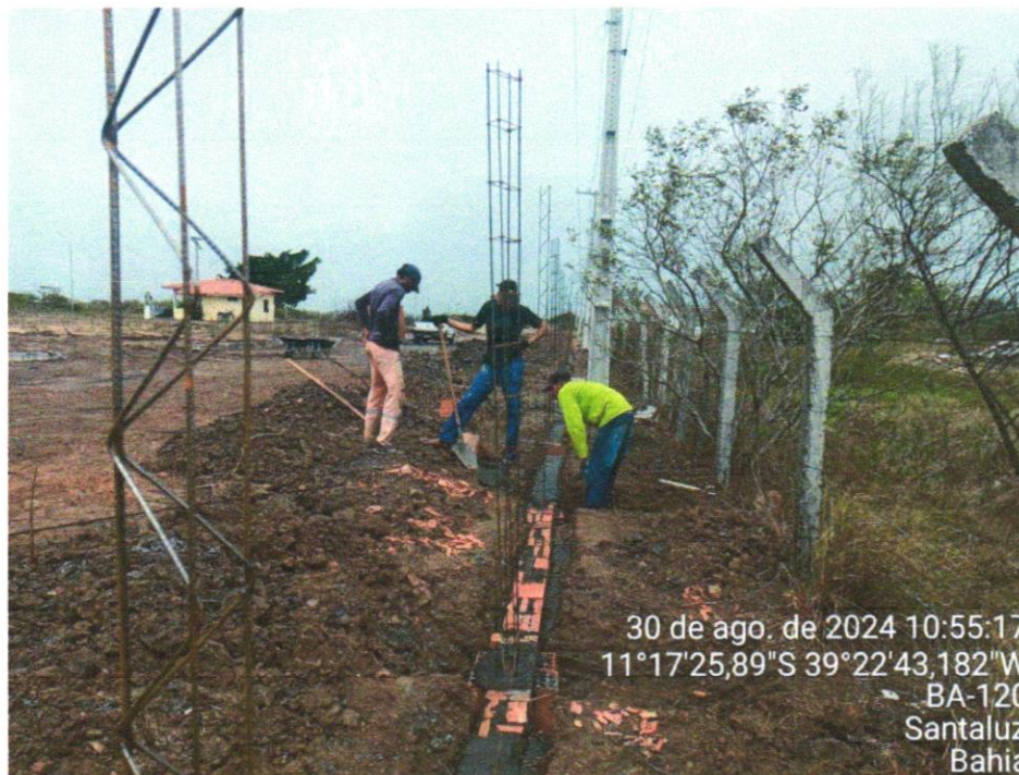
Foto 13 - (COMPOSIÇÃO REPRESENTATIVA) EXECUÇÃO DE ESTRUTURAS DE CONCRETO ARMADO, PARA EDIFICAÇÃO INSTITUCIONAL TÉRREA, FCK = 25 MPA. AF_01/2017