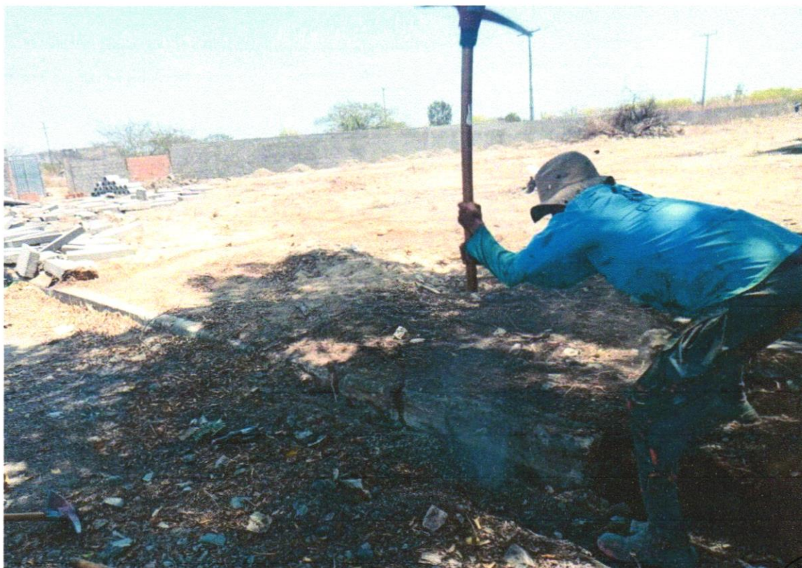
Foto 04- RETIRADA DE MEIO-FIO DNER / ECONOMICO COM EMPILHAMENTO E SEM BOTA FORA

Evaldo Almeida Moraes Engenheiro Civil RNP 051419303-3