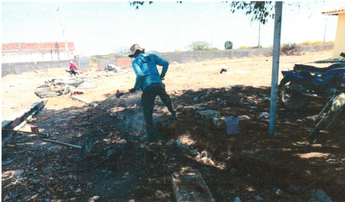
Foto 03 – RETIRADA DE MEIO-FIO DNER / ECONOMICO COM EMPILHAMENTO E SEM BOTA FORA