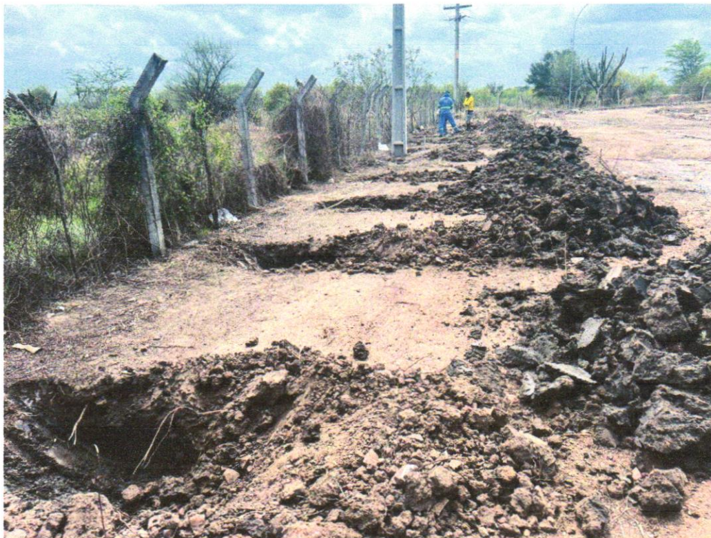
Foto 07 - ESCAVAÇÃO MANUAL DE VALA COM PROFUNDIDADE MENOR OU IGUAL A 1,30 M